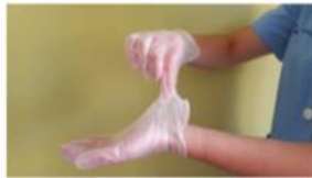
Pellizcar por el exterior del primer guante