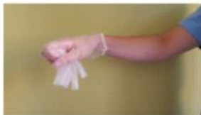
Recoger el primer guante con la otra mano