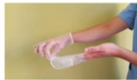
Retirar el guante en su totalidad