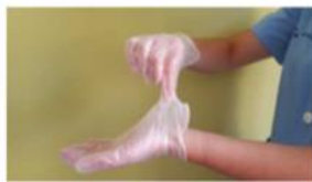
Pellizcar por el exterior del primer guante