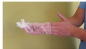
Retirar el segundo guante introduciendo los dedos por el interior