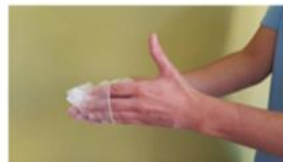
Retirar el guante sin tocar la parte externa del mismo