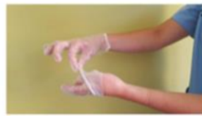
Retirar sin tocar la parte interior del guante